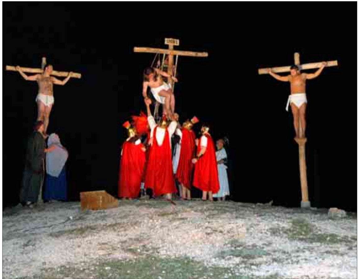
Un momento de la representación de la Pasión en Alcoba de la Torre.

que pagan seis euros al año, aunque puede que planteemos aumentar la cuota», añade. También en estos días se publicita la representación con los carteles, que se