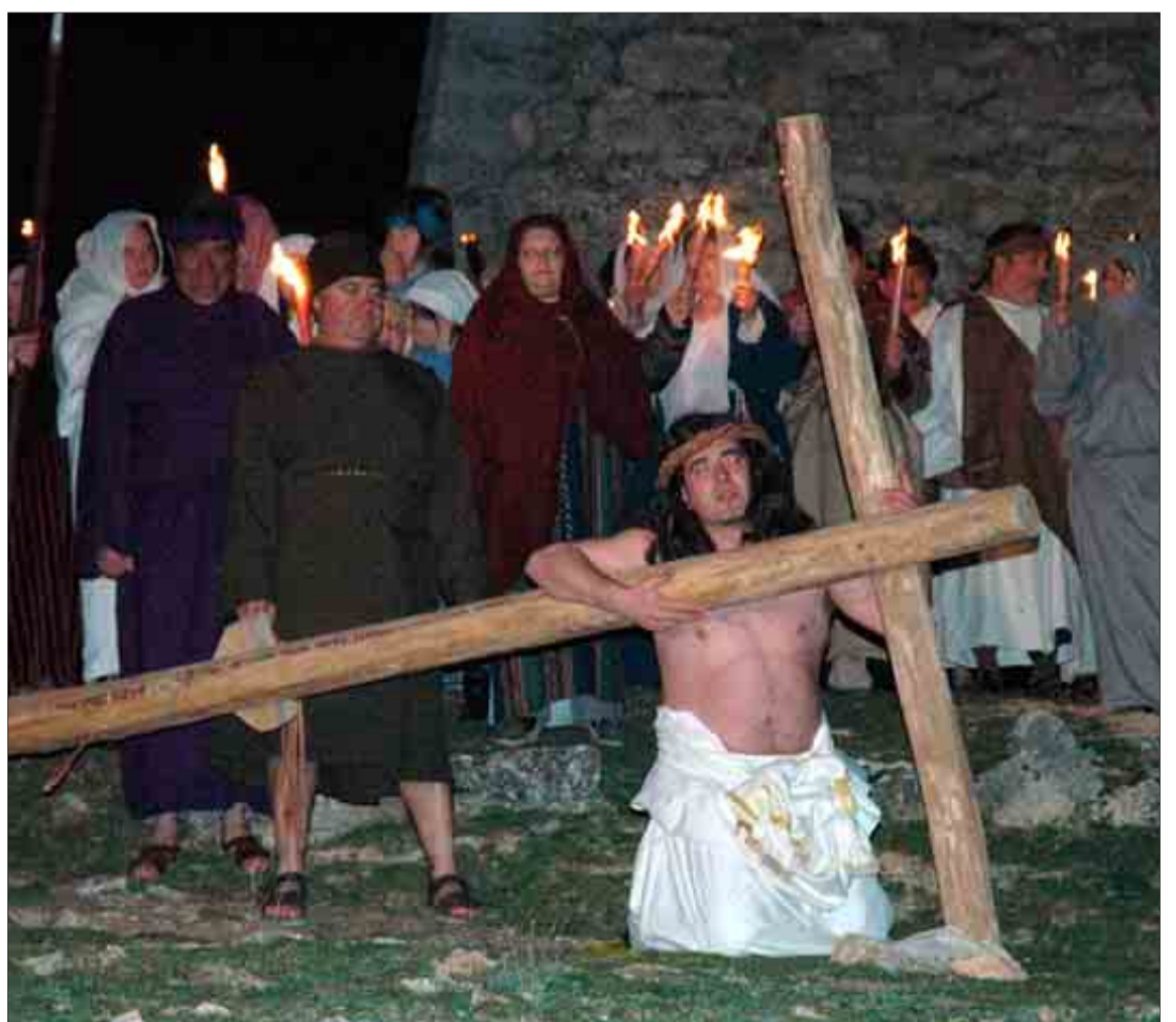
En esta tradición participan unas 200 personas.